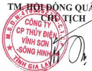
Võ Thành Trung