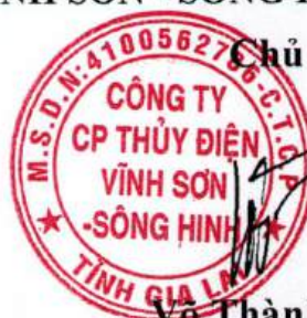
Võ Thành Trung